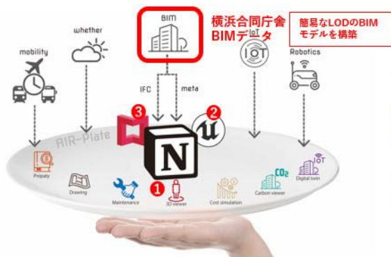
↑コンセプトイメージ

※マルチクラウド：複数のクラウドサービスを組み合わせて最適な環境を実現する運用形態のこと